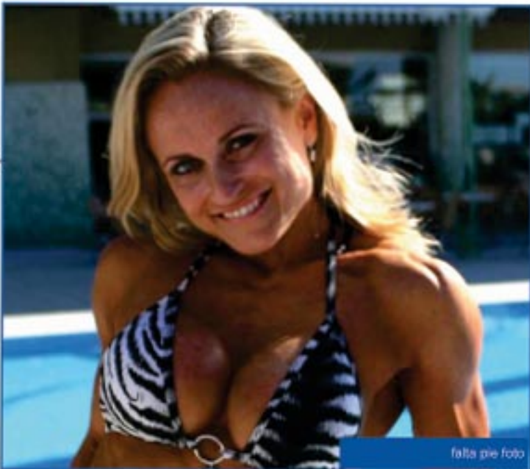
falta pie foto