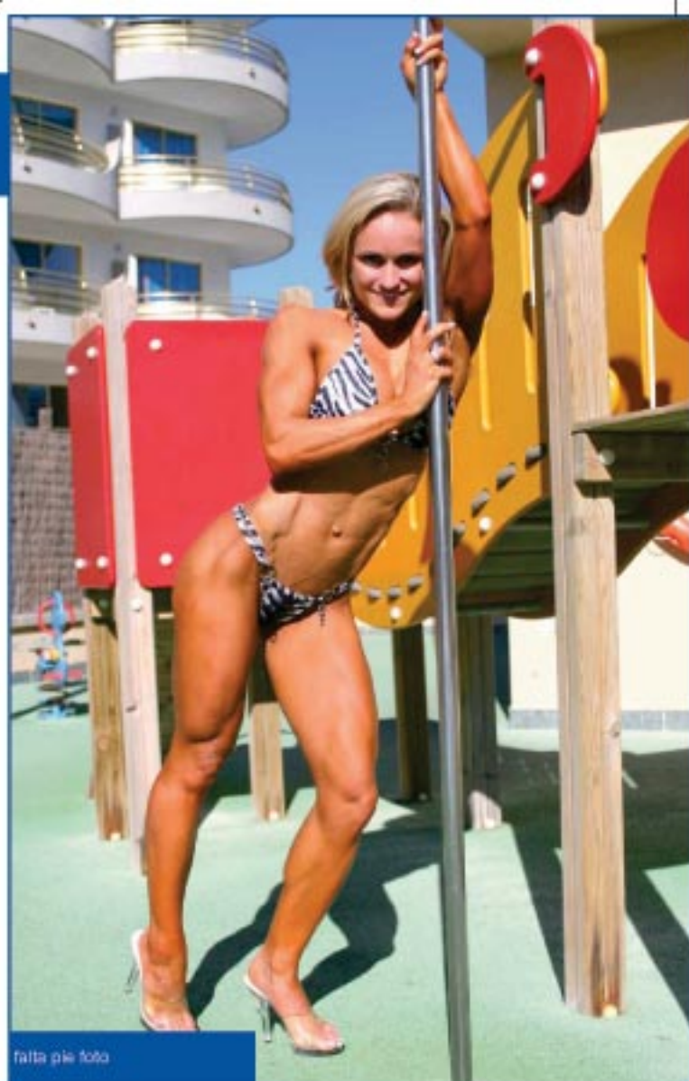
falta pie foto