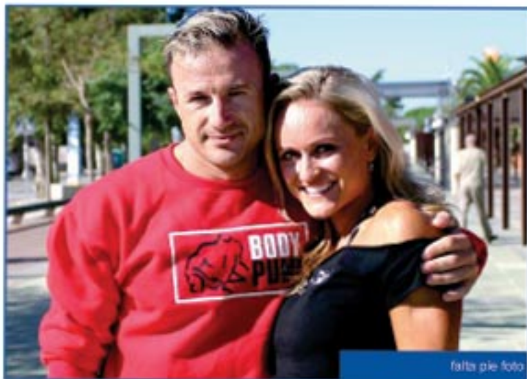
falta pie foto