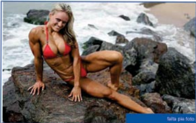
falta pie foto

M&F: ¿Entonces, te gustaría regresar a España a competir?