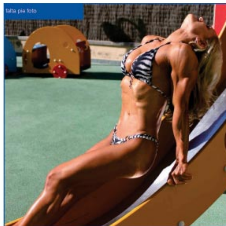
falta pie foto